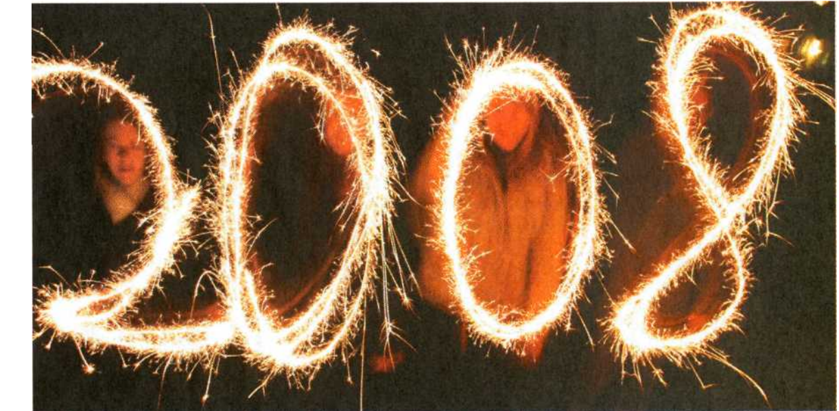
Gute Vorsätze sind schnell gemacht. Doch wie sieht es mit der Umsetzung aus?

Gefährliche Fragen! Denn wenn wir auf sie keine befriedigenden Antworten finden, gerät unser inneres Gleichgewicht ins Wanken. Und sind diese Fragen erst aufgetaucht, können wir sie nicht mehr abschütteln. Wir können sie bestenfalls unterdrücken - durch Arbeit, Alkohol, hektische Betriebs-